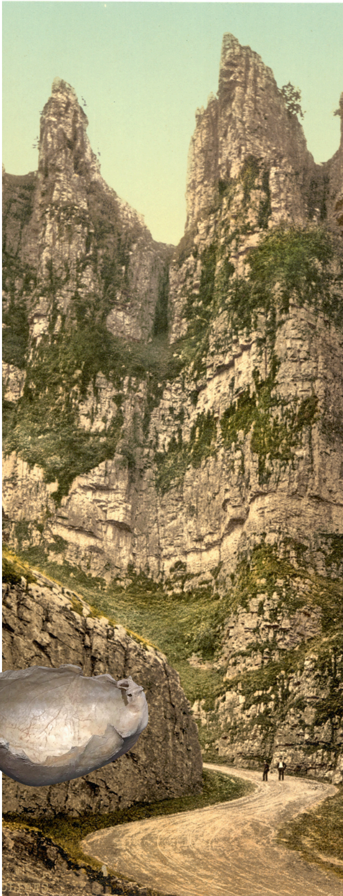
Gorges de Cheddar, Photochrome vers 1890 et détail d'un crâne ouvragé en forme de coupe.

Nulle part cette croyance n'a pris une forme plus élaborée, plus codifiée, plus profondément intégrée à une cosmologie entière, qu'à Bornéo.